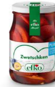
Zwetschken Pur ohne Kerne 370 ml