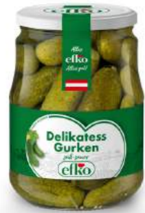
Delikatess Gurken süß-sauer 720 ml