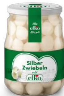
Silber Zwiebeln mild 720 ml