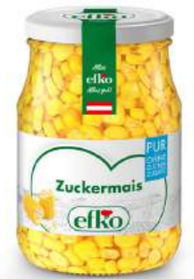
Zuckermais Pur 370 ml

pur ohne Zuckerzusatz. Unsere PUR-Linie richtet sich an alle, die bewusst genießen möchten, ohne auf Geschmack zu verzichten.