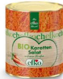
BIO Karotten Salat in feinen Streifen 3/1