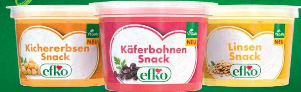
Kichererbsen Snack vegan 180 g