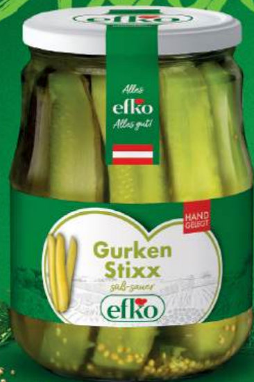
Gurken Stixx süß-sauer 720 ml