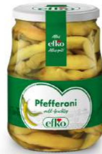
Pfefferoni mild-fruchtig 720 ml