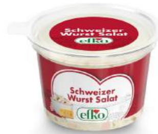
Schweizer Wurst Salat 200 g