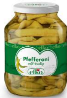
Pfefferoni mild-fruchtig 1.700 ml