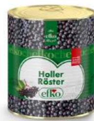
Holler Röster servierfertig 3 l