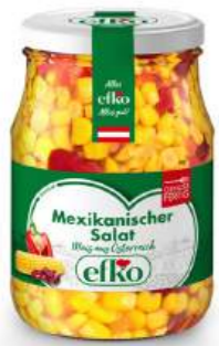
Mexikanischer Salat Mais aus Österreich 370 ml