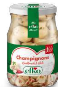
Champignons Knoblauch & Chili 370 ml