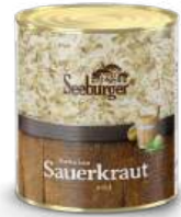
Sauerkraut 1 l