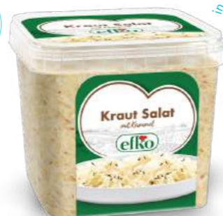
Kraut Salat mit Kümmel 1 kg