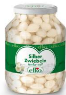
Silber Zwiebeln knackig-mild 1.700 ml