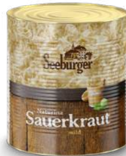
Sauerkraut 10 l