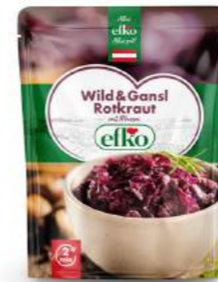
Wild & Gansl Rotkraut mit Maroni 350 g