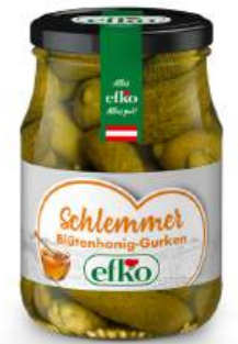
Schlemmer Gurken Blütenhonig 370 ml