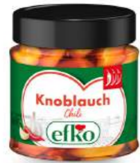
Knoblauch Chili 210 ml