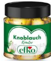
Knoblauch Kräuter 210 ml