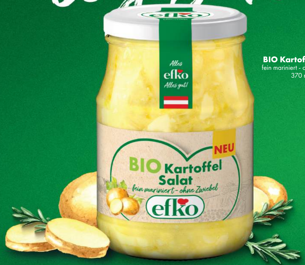
BIO Kartoffel Salat fein mariniert - ohne Zwiebel 370 ml