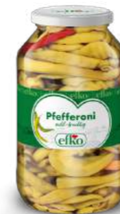
Pfefferoni mild-fruchtig 4.250 ml