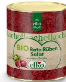
BIO Rote Rüben Salat in feinen Streifen 3/1