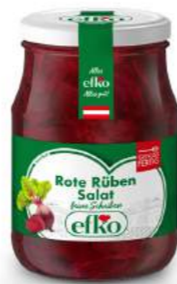
Rote Rüben Salat feine Scheiben 370 ml