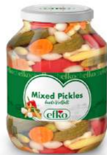
Mixed Pickles bunte Vielfalt 1.700 ml