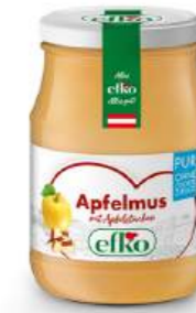
Apfelmus Pur mit Apfelstücken 370 ml