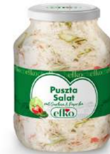
Puszta Salat mit Gurken & Paprika 1.700 ml