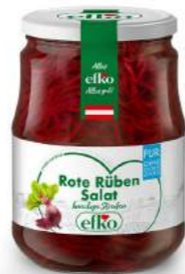
Rote Rüben Salat Pur knackige Streifen 720 ml