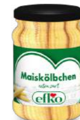
Maiskölbchen handgelegt 230 ml