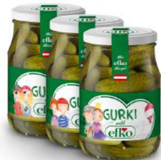
Gurki kleine, milde Gurkerl 370 ml