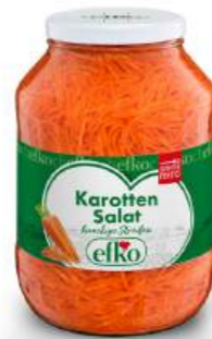
Karotten Salat knackige Streifen 2.650 ml