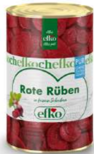
Rote Rüben Scheiben Pur in feinen Scheiben 5 l