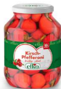
Kirsch-Pfefferoni fruchtig-scharf 1.700 ml