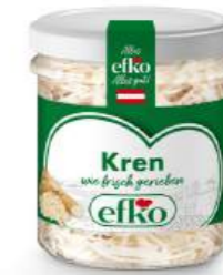
Kren wie frisch gerieben 165 ml