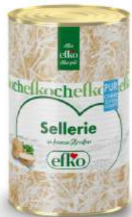
Sellerie Streifen Pur in feinen Streifen 5 l