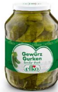
Gewürz Gurken knackig-frisch 2.650 ml