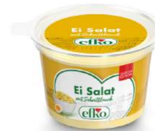
Ei Salat mit Schnittlauch 200 g