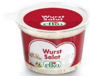
Wurst Salat 200 g