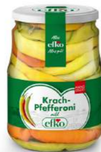
Krach-Pfefferoni handgelegt 720 ml