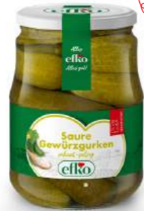
Saure Gewürzgurken pikant-salzig 720 ml