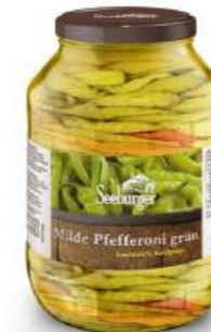
Pfefferoni mild, grün, handgelegt 2.650 ml