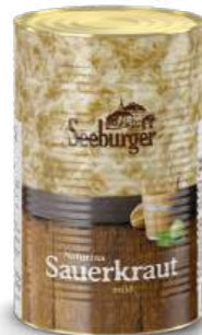
Sauerkraut 5 l