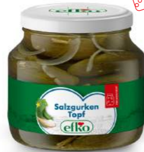
Salzgurken Topf salzig 1.000 ml