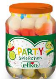
Party Spießchen handgesteckt 370 ml