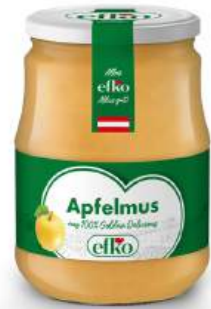
Apfelmus aus 100 % Golden Delicious 720 ml