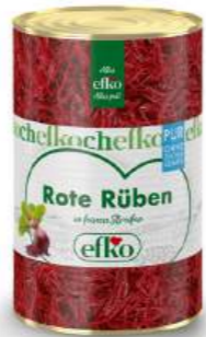
Rote Rüben Streifen Pur in feinen Streifen 5 l