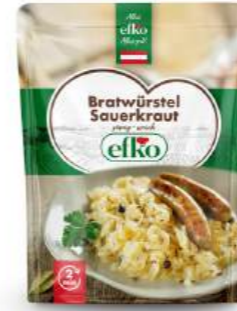
Bratwürstel Sauerkraut sämig-weich 350 g