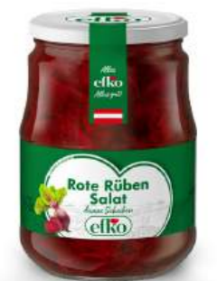
Rote Rüben Salat dünne Scheiben 720 ml