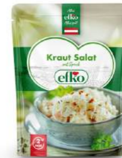
Kraut Salat mit Speck 350 g