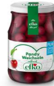
Pandy Weichseln Pur ohne Kerne 370 ml