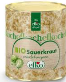
BIO Sauerkraut natürlich vergoren 3/1