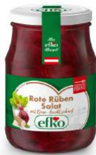
Rote Rüben Salat leicht scharf, mit Kren 370 ml