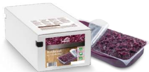
Rotkraut servierfertig 2 Beutel à 3.000 g je Karton