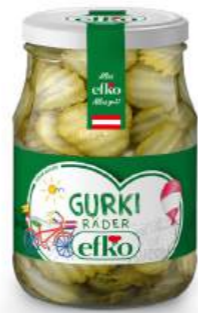
Gurki Räder Gurkenscheiben 370 ml