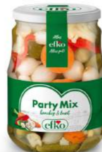
Party Mix knackig & bunt 720 ml