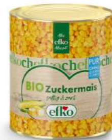
BIO Zuckermais Pur ohne Zuckerzusatz 3/1