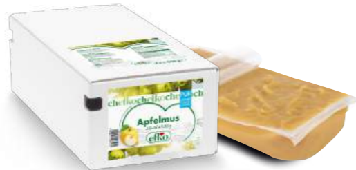
Apfelmus Pur ohne Zuckerzusatz 2 Beutel à 3.000 g