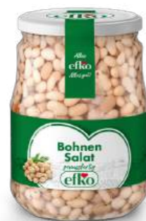
Bohnen Salat genussfertig 720 ml