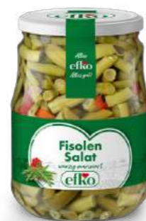
Fisolen Salat würzig mariniert 720 ml