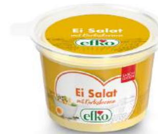
Ei Salat mit Kürbiskernen 200 g