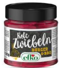
Rote Zwiebeln Burger & BBQ 210 ml