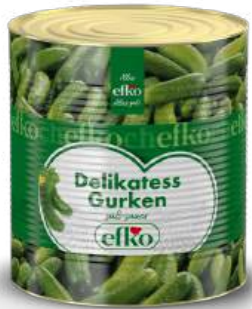
Delikatess Gurken 6 - 9 cm / 9 - 12 cm / 12 - 15 cm 10 l