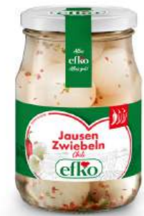
Jausen Zwiebeln mit Chili 370 ml