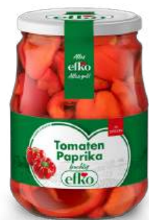
Tomaten Paprika fruchtig-in Stücken 720 ml