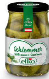
Schlemmer Gurken süß-sauer 370 ml