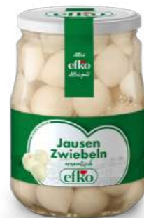
Jausen Zwiebeln aromatisch 720 ml