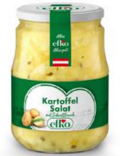
Kartoffel Salat mit Schnittlauch 720 ml