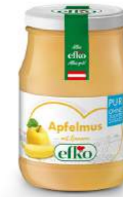
Apfelmus Pur mit Banane 370 ml