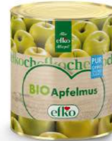
BIO Apfelmus Pur ohne Zuckerzusatz 3/1