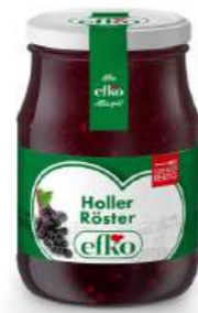
Holler Röster 370 ml