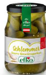
Schlemmer Gurken Saure Gewürzgurken 370 ml