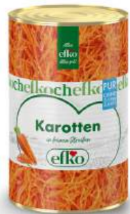
Karotten Streifen Pur in feinen Streifen 5 l