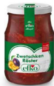
Zwetschken Röster 370 ml