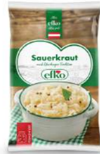
Delissa Sauerkraut nach Eferdinger Tradition 500 g