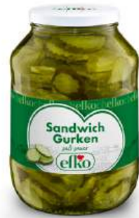
Sandwich Gurken süß-sauer 2.650 ml