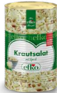
Krautsalat mit Speck 5 l