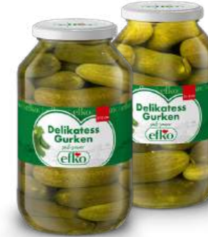
Delikatess Gurken 9 - 12 / 12 - 15 cm 4.250 ml