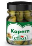
Kapern handverlesen 40 ml