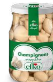
Champignons würzig & fein 370 ml