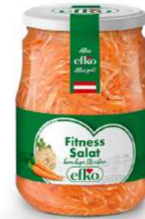
Fitness Salat knackige Streifen 720 ml