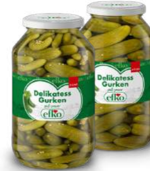
Delikatess Gurken 3 - 6 cm / 6 - 9 cm 4.250 ml