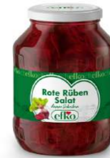
Rote Rüben Salat dünne Scheiben 1.700 ml