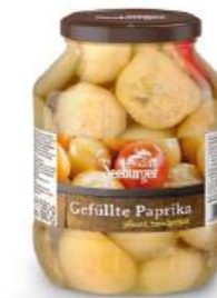
Gefüllte Paprika pikant, handgefüllt 1.700 ml