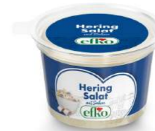
Hering Salat mit Sahne 200 g