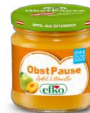
Obst Pause Apfel & Marille 216 ml