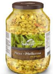
Pizza-Pfefferoni mild, geschnitten 2.650 ml