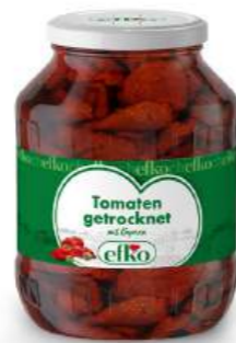
Getrocknete Tomaten mit Kapern 1.700 ml