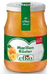
Marillen Röster 370 ml