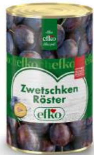
Zwetschken Röster servierfertig 5 l