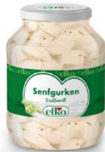
Senfgurken traditionell 1.700 ml