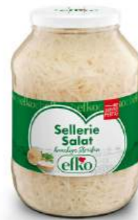
Sellerie Salat knackige Streifen 2.650 ml