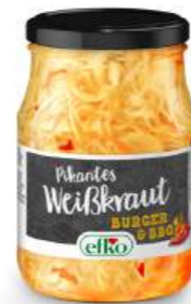
Pikantes Weißkraut Burger & BBQ 370 ml