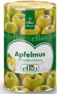
Apfelmus 100% Golden Delicious 5 l