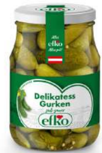
Delikatess Gurken süß-sauer 370 ml