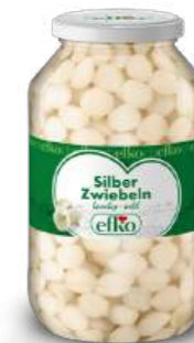
Silber Zwiebeln knackig-mild 4.250 ml