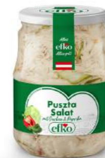
Puszta Salat mit Gurken & Paprika 720 ml