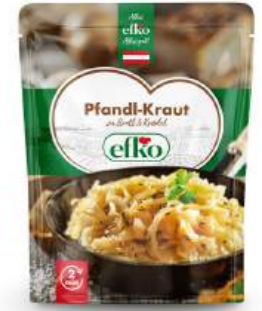
Pfandl-Kraut zu Bratl & Knödel 350 g