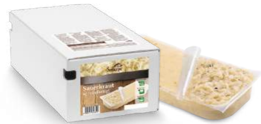
Sauerkraut servierfertig 2 Beutel à 3.000 g je Karton