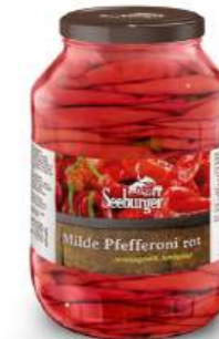
Pfefferoni mild, rot, handgelegt 2.650 ml