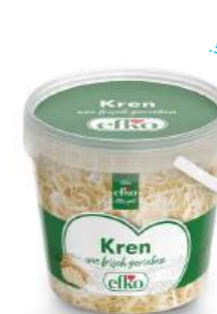
Kren wie frisch gerieben 250 g