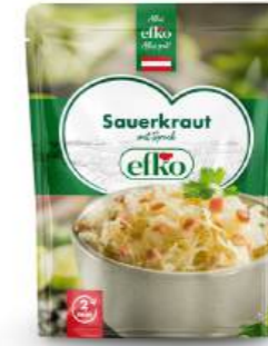
Sauerkraut mit Speck 350 g