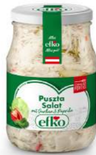
Puszta Salat mit Gurken und Paprika 370 ml