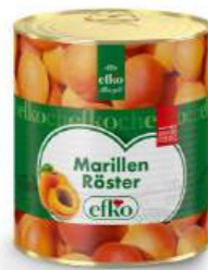
Marillen Röster servierfertig 3 l