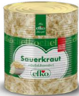
Sauerkraut natürlich fermentiert 10 l