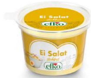
Ei Salat stichfest 200 g