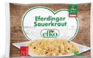
Eferdinger Sauerkraut der Klassiker 500 g