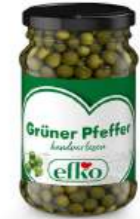
Grüner Pfeffer handverlesen 105 ml