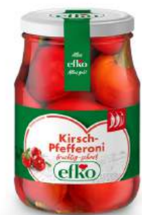
Kirsch-Pfefferoni fruchtig-scharf 370 ml