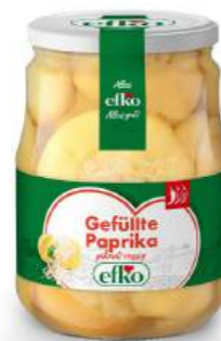
Gefüllte Paprika pikant-rassig 720 ml