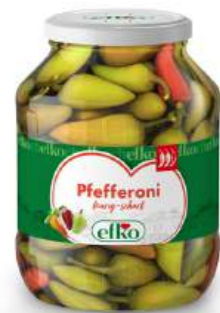
Pfefferoni feurig-scharf 1.700 ml