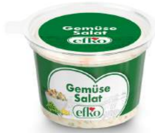
Gemüse Salat 200 g