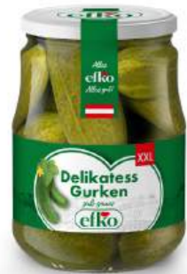
Delikatess XXL Gurken extra große Gurken 720 ml