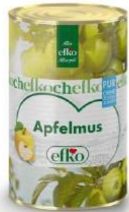
Apfelmus Pur ohne Zuckerzusatz 5 l