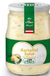
Kartoffel Salat mit Mayonnaise 720 ml