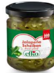
Jalapeño Scheiben feurig-scharf 212 ml