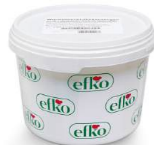
Wurstsemmelgurken Gurkenzungen 4.600 ml