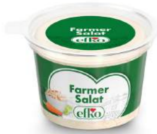
Farmer Salat 200 g