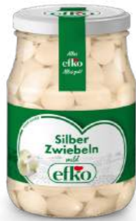
Silber Zwiebeln mild 370 ml