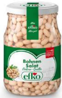
Bohnen Salat Protein-Quelle 370 ml