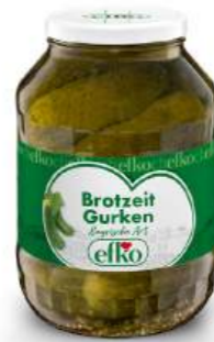
Brotzeitgurken Bayrische Art 2.650 ml