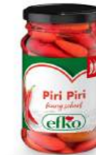
Piri Piri feurig-scharf 105 ml