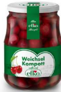
Weichsel Kompott ohne Kerne 720 ml