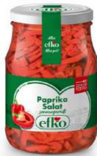
Paprika Salat sonnengereift 370 ml