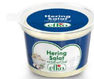
Hering Salat mit Dill & Senf 200 g