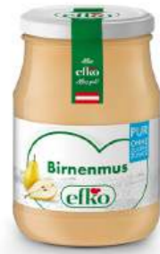
Birnenmus Pur 370 ml