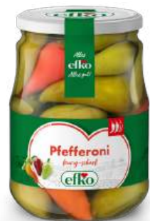
Pfefferoni feurig-scharf 720 ml