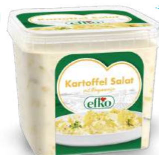
Kartoffel Salat mit Mayonnaise 1 kg