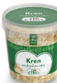
Kren wie frisch gerieben 500 g