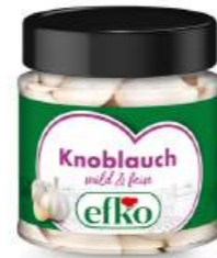
Knoblauch mild & fein 210 ml