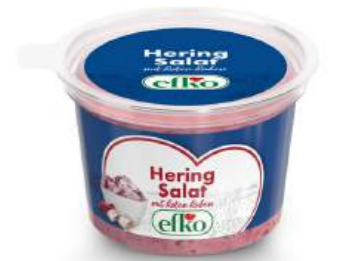
Hering Salat mit Roten Rüben 200 g