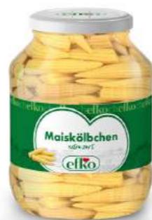
Maiskölbchen extra zart 1.700 ml