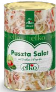
Puszta Salat mit Gurken und Paprika 5 l