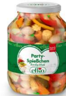
Party-Spießchen handgesteckt 1.700 ml