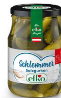
Schlemmer Gurken Salzgurken 370 ml