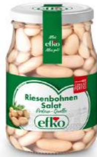
Riesenbohnen Salat Protein-Quelle 370 ml