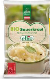
BIO Sauerkraut Eferdinger Traditionsrezept 500 g