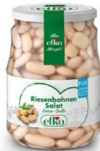
Riesenbohnen Salat Pur Protein-Quelle 720 ml