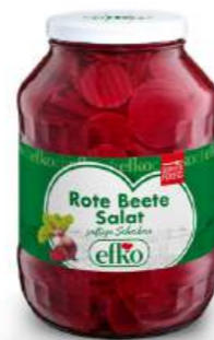
Rote Beete Salat saftige Scheiben 2.650 ml