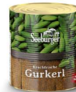
Krachfrische Gurkerl 6 - 9 cm 10 l