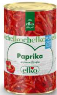
Paprika Streifen Pur in feinen Streifen 5 l