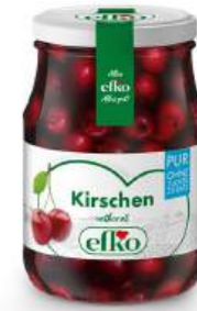
Kirschen Pur ohne Kerne 370 ml