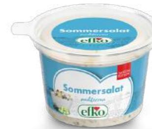
Mediterraner Sommersalat 200 g