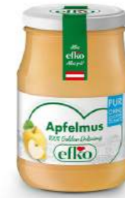
Apfelmus Pur aus 100 % Golden Delicious 370 ml