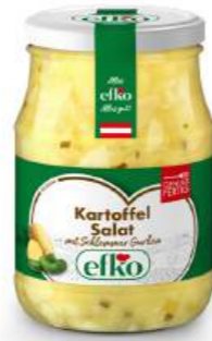
Kartoffel Salat mit Schlemmer Gurken 370 ml