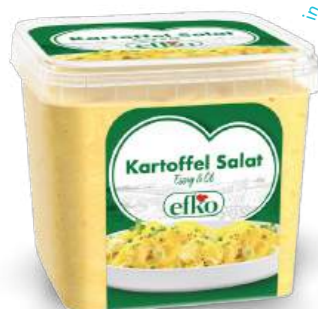
Kartoffel Salat Klassik, Essig & Öl 1 kg