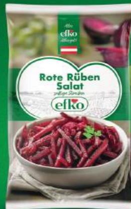
Rote Rüben Salat saftige Streifen 500 g