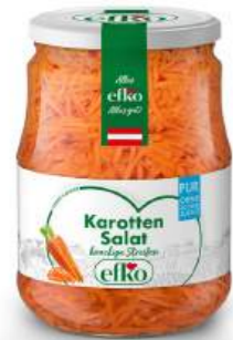
Karotten Salat Pur knackige Streifen 720 ml