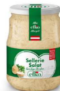
Sellerie Salat knackige Streifen 720 ml