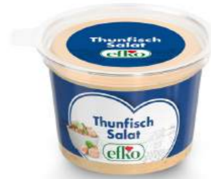
Thunfisch Salat 200 g