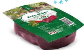
Rote Rüben im Ganzen gekocht und geschält 500 g