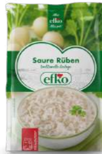
Saure Rüben traditionelle Beilage 350 g