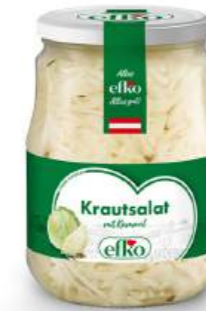
Krautsalat mit Kümmel in Essig & Öl - Marinade 720 ml