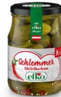
Schlemmer Gurken scharfe Chili 370 ml