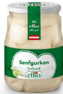
Senfgurken traditionell 720 ml