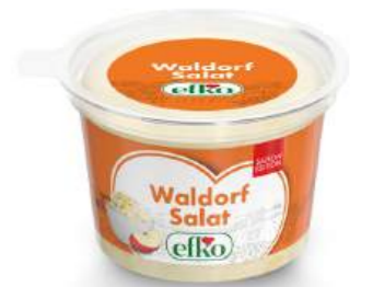
Waldorf Salat 200 g