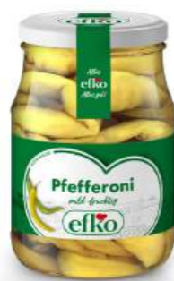
Pfefferoni mild-fruchtig 370 ml