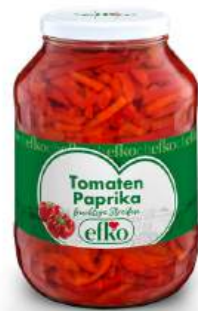
Tomaten Paprika fruchtige Streifen 2.650 ml