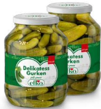
Delikatess Gurken 3 - 6 cm / 6 - 9 cm 1.700 ml