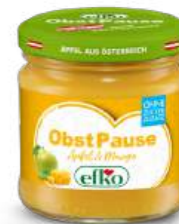
Obst Pause Apfel & Mango 216 ml