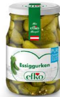
Essiggurken Pur 370 ml

pur ohne Zuckerzusatz. Unsere PUR-Linie richtet sich an alle, die bewusst genießen möchten, ohne auf Geschmack zu verzichten.