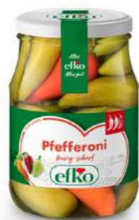
Pfefferoni feurig-scharf 370 ml