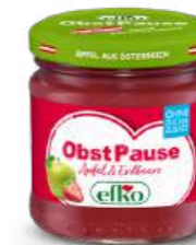
Obst Pause Apfel & Erdbeere 216 ml