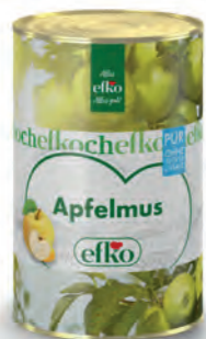
Apfelmus Pur ohne Zuckerzusatz 5 l