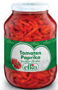
Tomaten Paprika fruchtige Streifen 2.650 ml