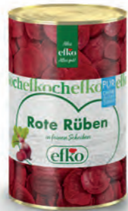
Rote Rüben Scheiben Pur in feinen Scheiben 5 l