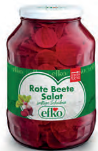
Rote Beete Salat saftige Scheiben 2.650 ml