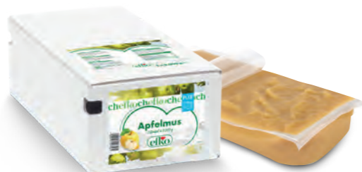
Apfelmus Pur ohne Zuckerzusatz 2 Beutel à 3.000 g