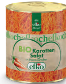
BIO Karotten Salat in feinen Streifen 3/1