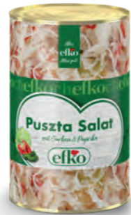
Puszta Salat mit Gurken und Paprika 5 l