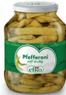
Pfefferoni mild-fruchtig 1.700 ml