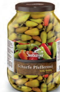
Pfefferoni scharf 2.650 ml