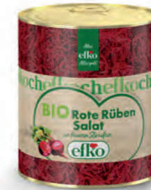
BIO Rote Rüben Salat in feinen Streifen 3/1