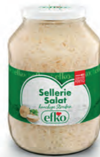
Sellerie Salat knackige Streifen 2.650 ml