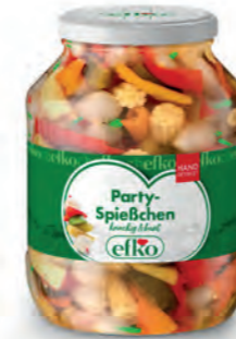
Party-Spießchen handgesteckt 1.700 ml