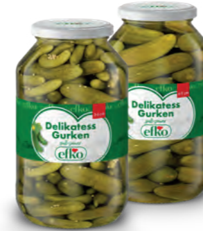
Delikatess Gurken 3 - 6 cm / 6 - 9 cm 4.250 ml