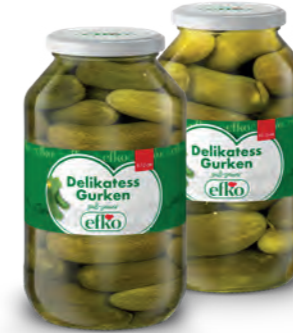
Delikatess Gurken 9 - 12 / 12 - 15 cm 4.250 ml