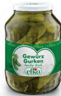
Gewürz Gurken knackig-frisch 2.650 ml