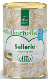
Sellerie Streifen Pur in feinen Streifen 5 l