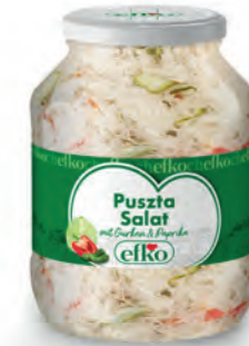
Puszta Salat mit Gurken & Paprika 1.700 ml