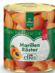
Marillen Röster servierfertig 3 l