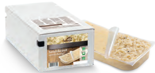
Sauerkraut servierfertig 2 Beutel à 3.000 g je Karton