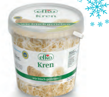
Kren wie frisch gerieben 500 g