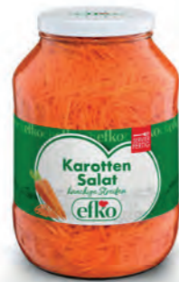
Karotten Salat knackige Streifen 2.650 ml