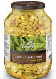
Pizza-Pfefferoni mild, geschnitten 2.650 ml