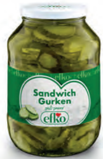
Sandwich Gurken süß-sauer 2.650 ml