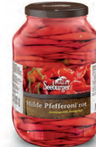
Pfefferoni mild, rot, handgelegt 2.650 ml