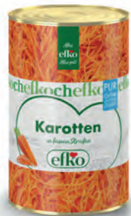
Karotten Streifen Pur in feinen Streifen 5 l