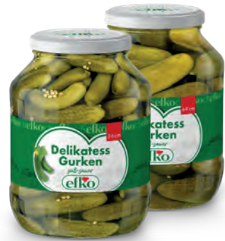
Delikatess Gurken 3 - 6 cm / 6 - 9 cm 1.700 ml