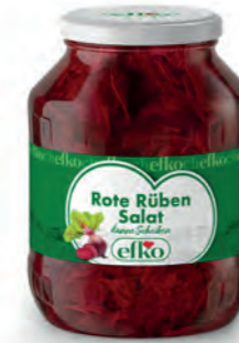
Rote Rüben Salat dünne Scheiben 1.700 ml