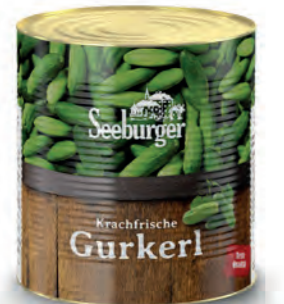
Krachfrische Gurkerl 6 - 9 cm 10 l