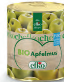
BIO Apfelmus Pur ohne Zuckerzusatz 3/1