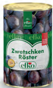
Zwetschken Röster servierfertig 5 l