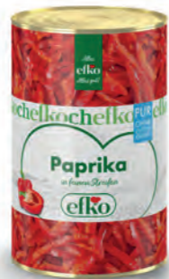
Paprika Streifen Pur in feinen Streifen 5 l