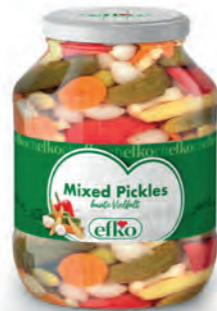
Mixed Pickles bunte Vielfalt 1.700 ml