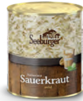
Sauerkraut 1 l