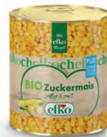
BIO Zuckermais Pur ohne Zuckerzusatz 3/1