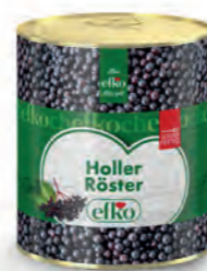
Holler Röster servierfertig 3 l