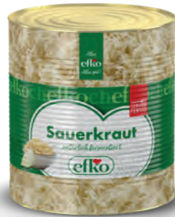
Sauerkraut natürlich fermentiert 10 l