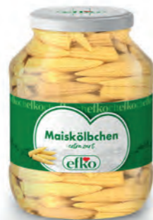
Maiskölbchen extra zart 1.700 ml