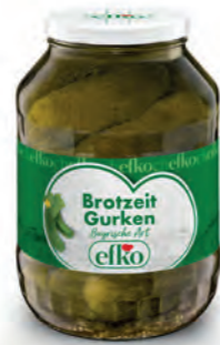
Brotzeitgurken Bayrische Art 2.650 ml