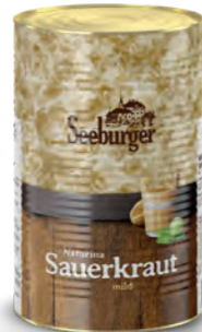
Sauerkraut 5 l