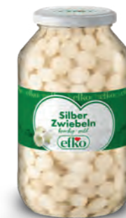
Silber Zwiebeln knackig-mild 4.250 ml