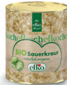
BIO Sauerkraut natürlich vergoren 3/1