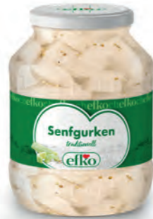
Senfgurken traditionell 1.700 ml