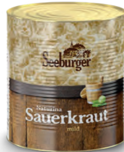
Sauerkraut 10 l