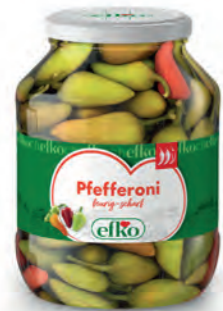
Pfefferoni feurig-scharf 1.700 ml