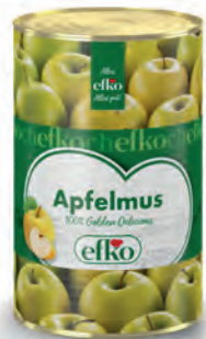
Apfelmus 100% Golden Delicious 5 l