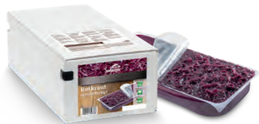
Rotkraut servierfertig 2 Beutel à 3.000 g je Karton