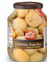
Gefüllte Paprika pikant, handgefüllt 1.700 ml