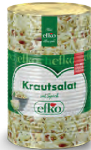
Krautsalat mit Speck 5 l