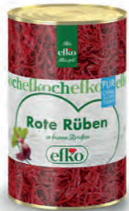
Rote Rüben Streifen Pur in feinen Streifen 5 l