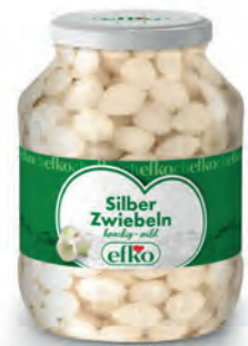
Silber Zwiebeln knackig-mild 1.700 ml