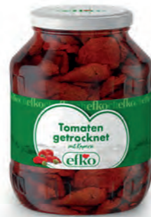
Getrocknete Tomaten mit Kapern 1.700 ml