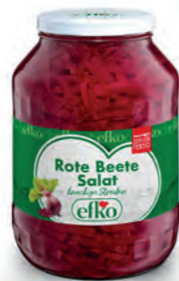
Rote Beete Salat knackige Streifen 2.650 ml