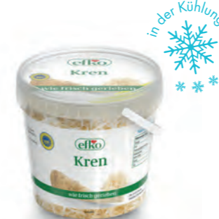
Kren wie frisch gerieben 250 g