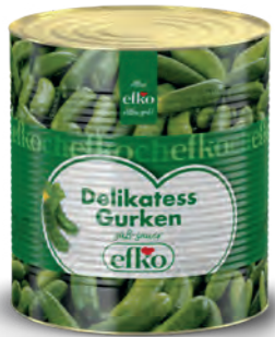
Delikatess Gurken 6 - 9 cm / 9 - 12 cm / 12 - 15 cm 10 l