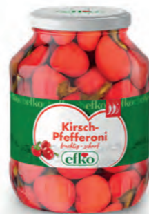
Kirsch-Pfefferoni fruchtig-scharf 1.700 ml