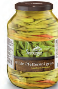
Pfefferoni mild, grün, handgelegt 2.650 ml