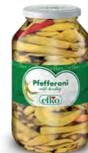
Pfefferoni mild-fruchtig 4.250 ml